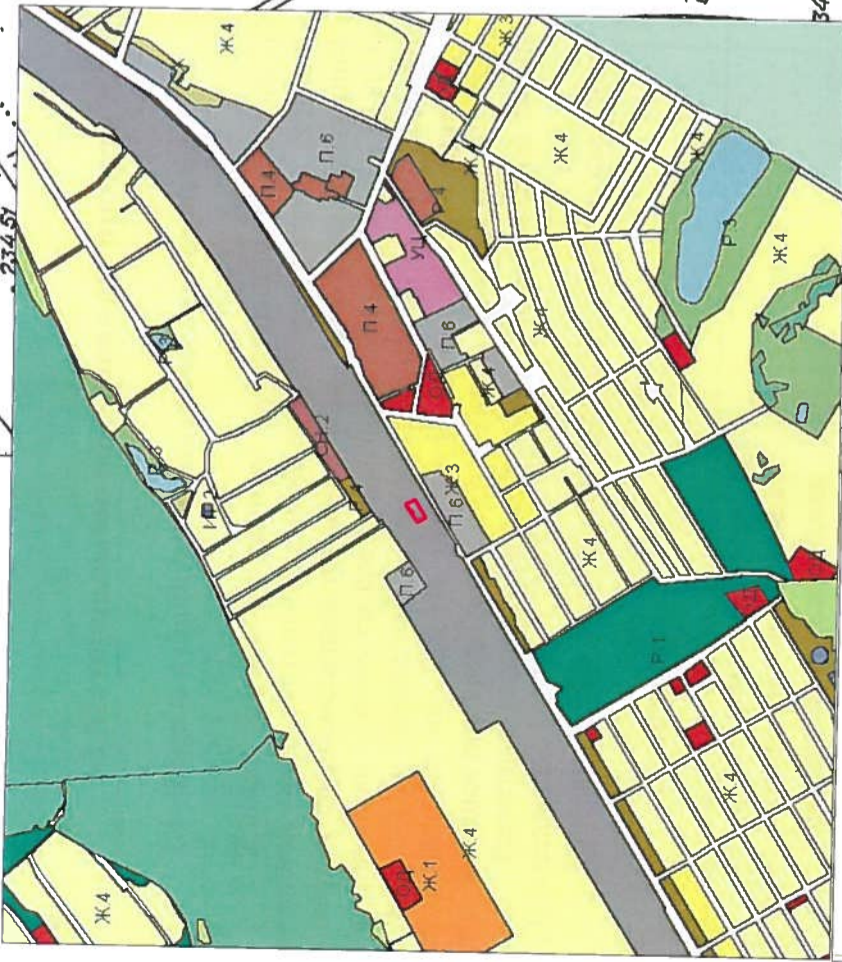
СХЕМА РАСПОЛОЖЕНИЯ ЭЛЕМЕНТОВ ПЛАНИРОВОЧНОЙ СТРУКТУРЫ