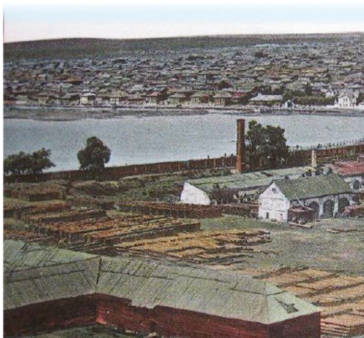
Барнаул. XVIII в. Панорама сереброплавильного завода

Рудники Змеиногорской системы стали богатейшей серебряной кладовой России. В XVIII – первой половине XIX вв. на Алтае выплавляли 90 процентов российского серебра. Барнаульский сереброплавильный завод по