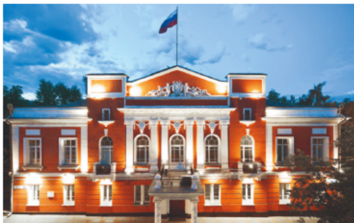
Дом начальника Колывано-Воскресенского горного округа (проспект Ленина, 18)

В память об этой драме возникла традиция. Ранним утром, с первыми лучами солнца, приносить на крыльцо особняка цветы как символ поклонения Женственности, Красоте и Любви. Принеся розу в дар голубой даме, непременно получите ее покровительство... и вечную Любовь.