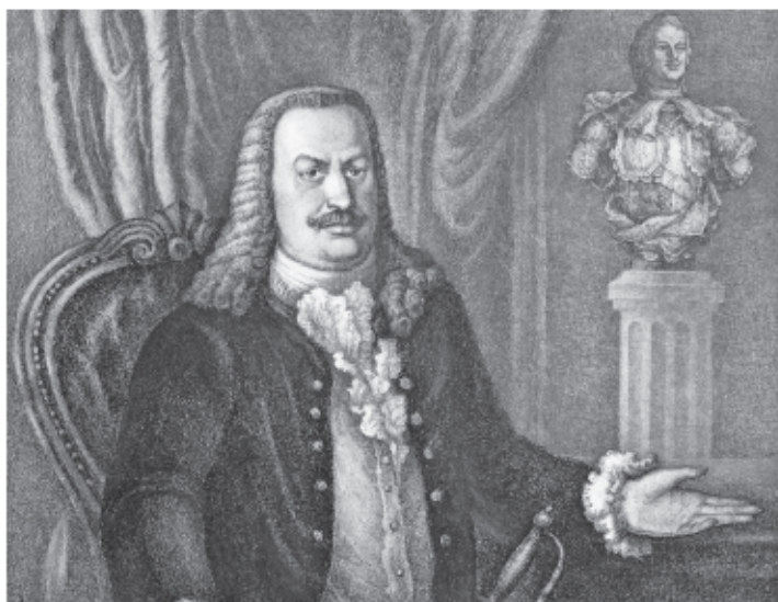
Акинфий Никитич Демидов (1678 — 1745)

Поэтому до сих пор земля Алтая хранит демидовское серебро. И, говорят, нетрудно его найти, изучив историю развития горнорудного дела на Алтае.