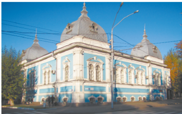
Здание бывшего Барнаульского духовного училища (проспект Ленина, 17)

Рассказывают, что эти здания связывает подземный коридор. А сегодня по нему ходит голубая дама, известная всем барнаульцам как призрак молодой жены генерала, замуровавшего ее в стену в порыве ревности.