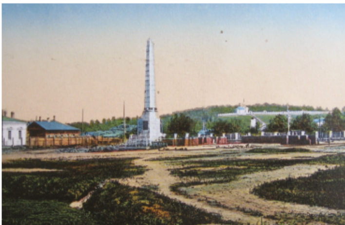
Демидовская площадь. Обелиск в честь 100-летия горного дела на Алтае

Очень благоприятно побывать на Демидовской площади, где установлен обелиск в честь 100-летия горного дела на Алтае. Существует примета: если обойти Демидовский столп три раза и каждый раз оставлять у его основания по монете, вы можете стать богатым человеком. Только имейте в виду, что богатство каждый понимает по-своему.