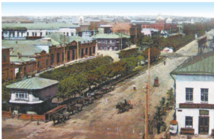
Московский проспект (сегодня проспект Ленина)

Барнаул и сегодня хранит в себе прошлое. Он для тех, кто помнит и возрождает наследие наших предков. Посетите наш город – и вы в этом убедитесь сами.