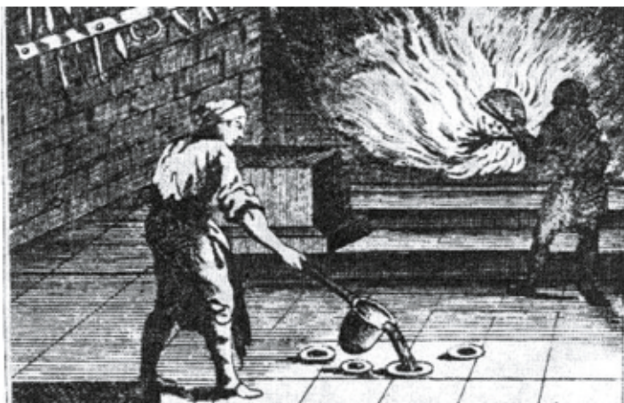
У плавильной печи. XVIII в.

И до сих пор что-то завораживающее и неведомое излучает завод – не отпускает барнаульцев из родного города! И кто хотя бы раз приедет в наш город, то обязательно вернется. Прикоснитесь к стенам сереброплавильного завода – вдруг он и вас «приворожит»!