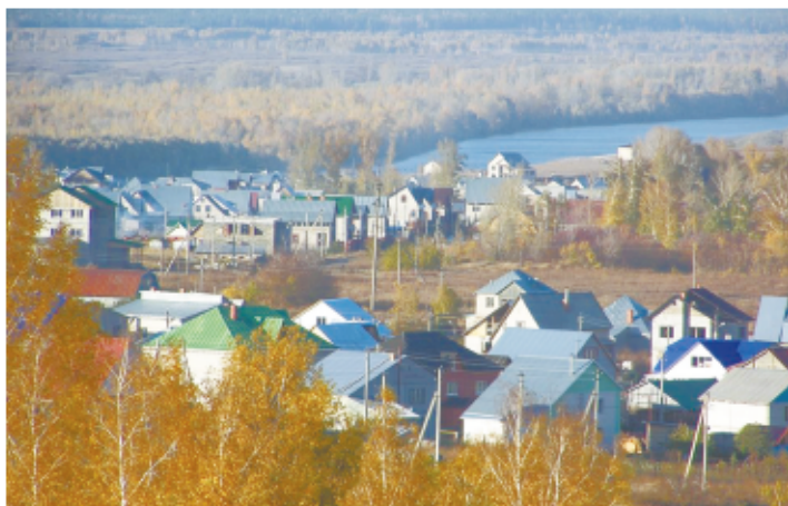
Село Гоньба на реке Оби

Рассказывают историю о том, что через село регулярно перегоняли «повозки-серебрянки» с драгоценным металлом. Промышлявший в окрестностях села разбойный народ иной раз совершал на них набеги, грабил казенный запас. Стража от них в основном успешно отбивалась. Однажды отбившую повозку спрятали. Затем долго искали, но поиски ни к чему не привели. Сокровище как в воду кануло. Старожилы говорят, что где-то возле Гоньбы оно до сих пор хранится. Возможно, кому-нибудь и посчастливится найти пропавшую «серебрянку»?