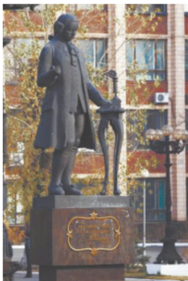
Иван Иванович Ползунов (1728 — 1766)

Впрочем, чудодейственная сила Ползунова дошла и до наших дней. Есть на проспекте Ленина у Алтайского государственного технического университета памятник Ползунову. Это особый талисман на удачу для алтайских студентов. Если в день экзамена потереть правый ботинок памятника, то пятерка будет обеспечена. Правда, везет почему-то тем, кто отличается трудолюбием и прилежанием. Не любит бездельников творец «огненной машины».