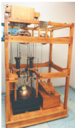
Макет паровой машины Ивана Ивановича Ползунова