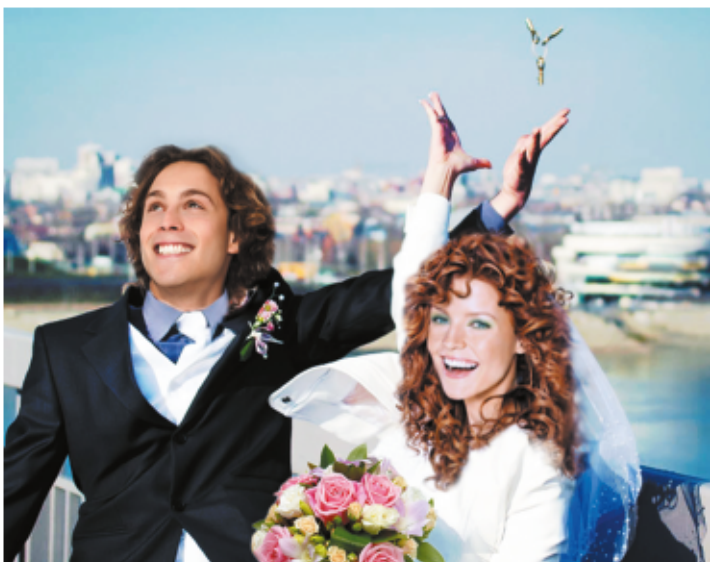
Обь – хранительница ключей счастья

Самое время присоединиться к горожанам, ведь они смело утверждают, что мост на речном вокзале как нельзя лучше подходит для свиданий и признаний в любви. Действительно, сюда после житейских дел и важных проблем приходят десятки влюбленных пар полюбоваться на течение воды, почувствовать порывы ветра и просто посмотреть друг другу в глаза. Здесь назначают свидания и дарят поцелуи, а те, кто решил сочетаться браком, приезжают сюда в день свадьбы, пьют шампанское, бросают венки в воду на счастье. Также «сковывают» свой брак замочком, который хранят у себя дома на самом почетном месте. А ключ от замочка, естественно, бросают в реку – верную хранительницу «ключей от счастья».