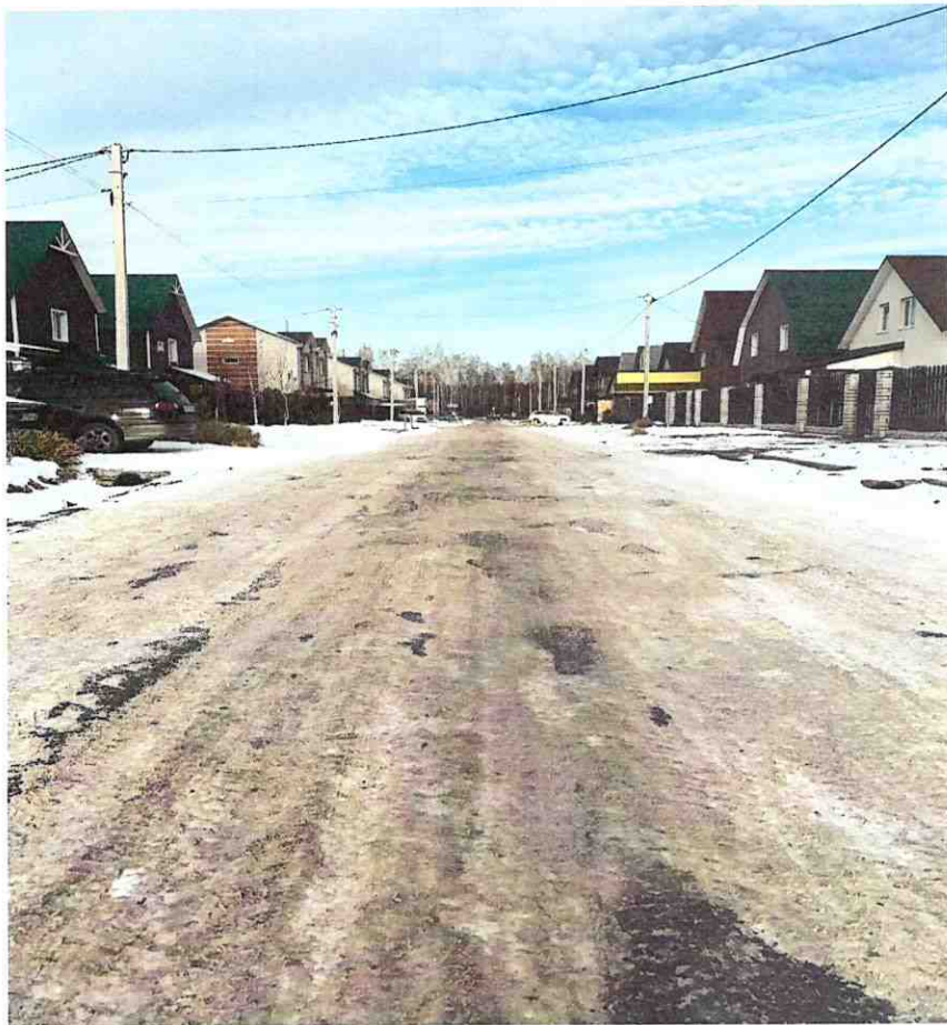
Фото ул.Вологодской, п.Центральный до начала проекта