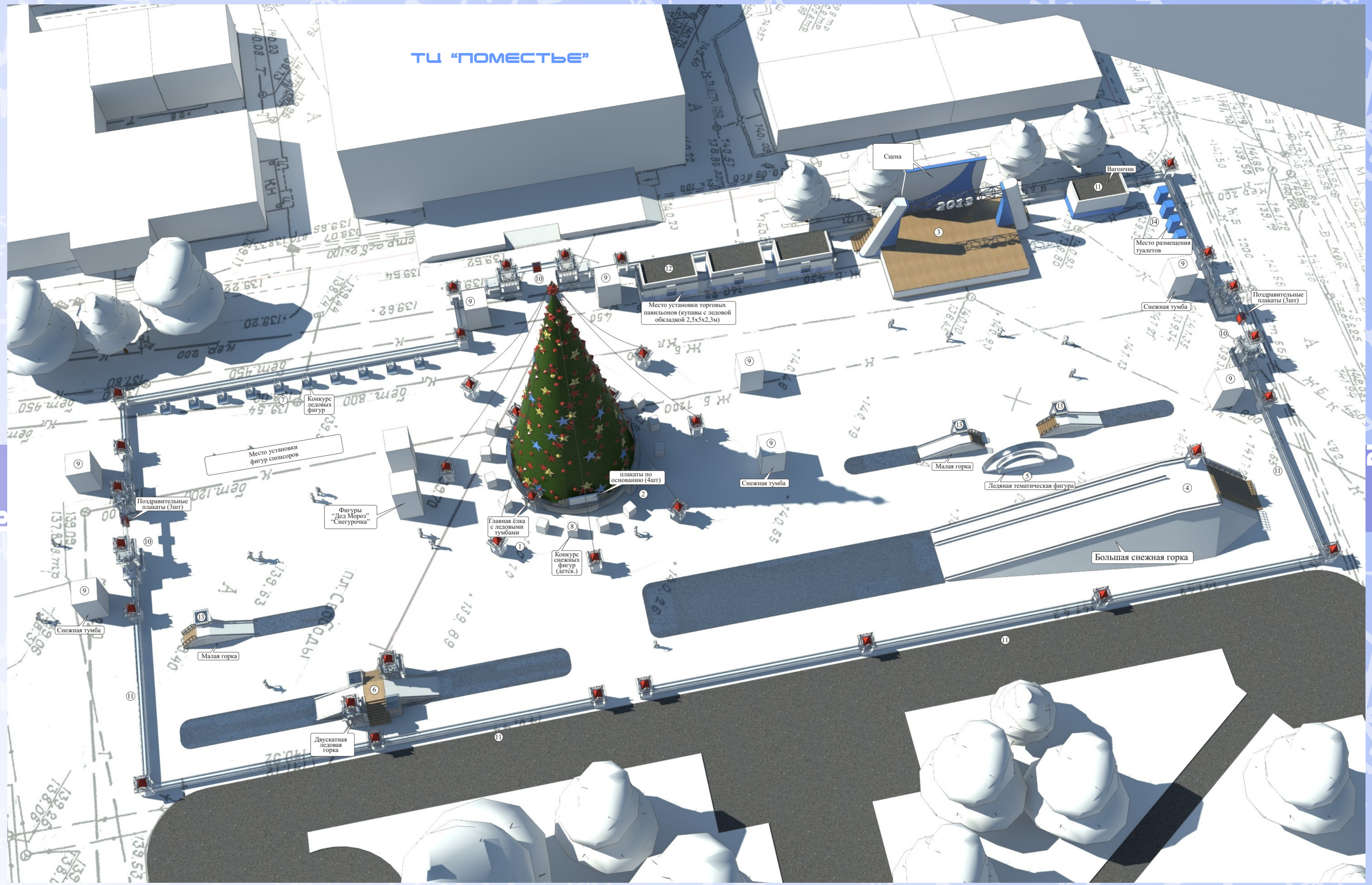
СХЕМА ОФОРМЛЕНИЯ ПЛ.СВОБОДЫ К НОВОГОДНИМ МЕРОПРИЯТИЯМ 2012 - 2013Г.