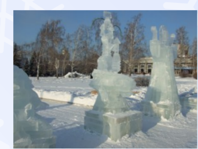
КОНКУРС ЛЕДОВОЙ И СНЕЖНОЙ СКУЛЬПТУРЫ