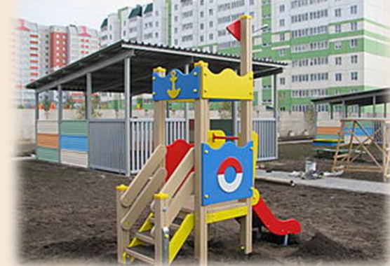
Строительство детского сада в квартале 2018