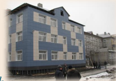
Строительство детского сада в квартале 2003

➤ В 2014 году функционировало 75 групп кратковременного пребывания. Предшкольной подготовкой охвачено 2647 детей дошкольного возраста